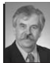
Jacques Vézina Centre hospitalier universitaire de Québec Pavillon Hôtel-Dieu Québec (03)