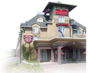
Le Ramada Plaza Le Manoir Casino

Bref, l'AGA 2009 a connu un grand succès et nous espérons que la prochaine assemblée saura être à la hauteur !