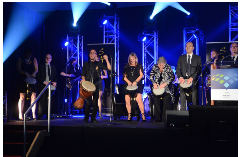
Les membres du comité exécutif qui ont maîtrisé l'art du djembé pour un numéro musical d'ouverture du tonnerre!