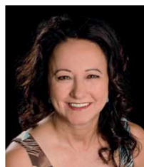
Côte-Nord FRANCE ALBERT